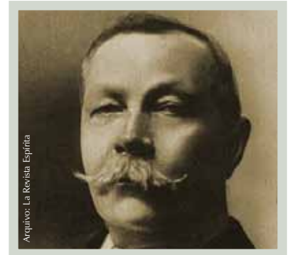
SIR ARTHUR CONAN DOYLE (1859 - 1930)